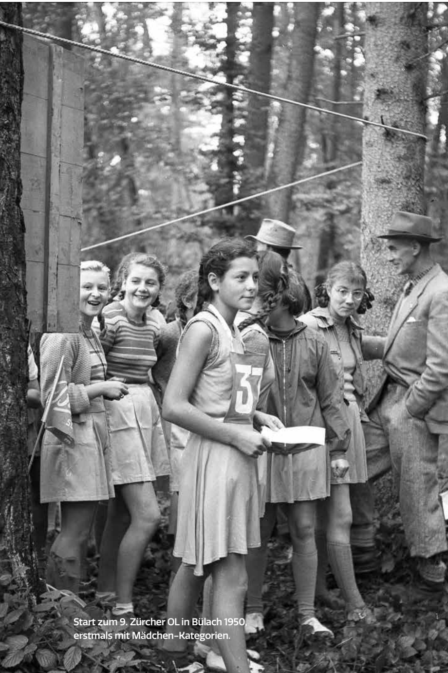
Start zum 9. Zürcher OL in Bülach 1950 erstmals mit Mädchen-Kategorien.