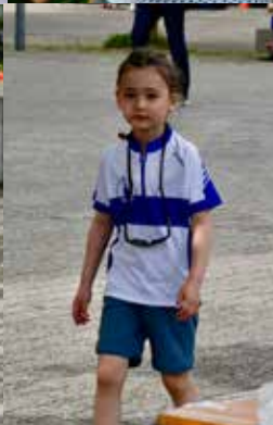
Zuger Frühlings-OL 2025